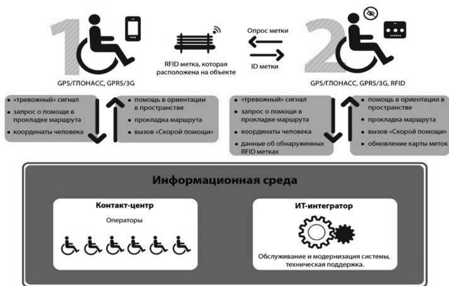
Рис. 2. Функциональная схема построения системы

Например, это могут лица с проблемами опорно-двигательного аппарата, с одной стороны, легко включающиеся в использование смарт-технологий, а с другой, – понимающие проблему инвалидов. В целом организационно-функциональная модель такой системы представлена на рис. 2.