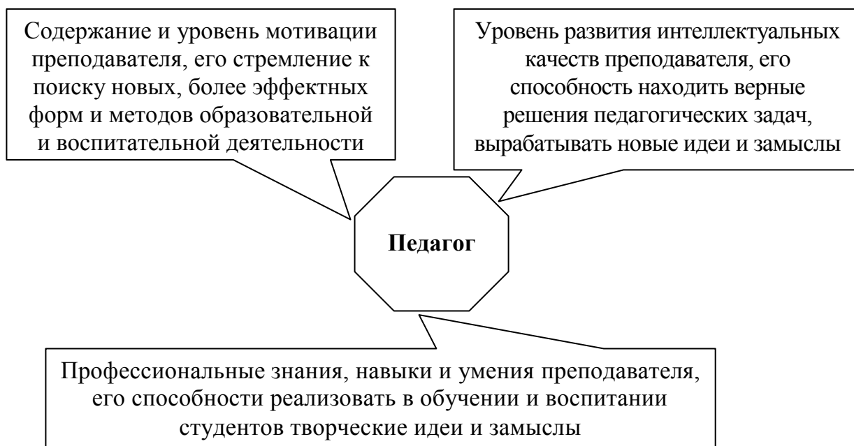
Рис. 1. Личностные качества, влияющие на педагогическое творчество преподавателя

чество подготовки специалистов; стремлением привить студентам интерес к предмету и добиться глубоких знаний по изучаемому предмету и др.);