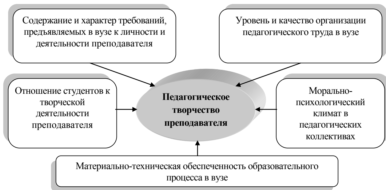
Рис. 2. Социально-педагогические факторы, влияющие на педагогическое творчество преподавателя

по педагогическим измерительным материалам, которые использовались Федеральной службой по надзору в сфере образования и науки РФ при экспертизе качества образования в вузах. 37% преподавателей указывают на то, что систематическая требовательность со стороны руководителей вузов, факультетов и кафедр при отсутствии помощи и поддержки не способствует творчеству профессорско-преподавательского состава.