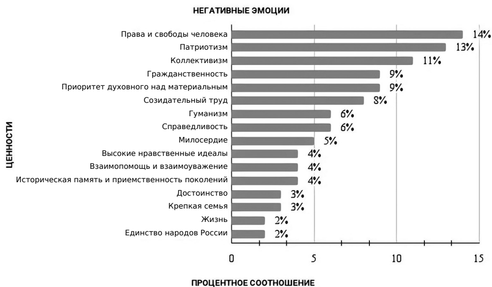
Рисунок 2. Восприятие студентами ценностей через негативное эмоциональное отношение