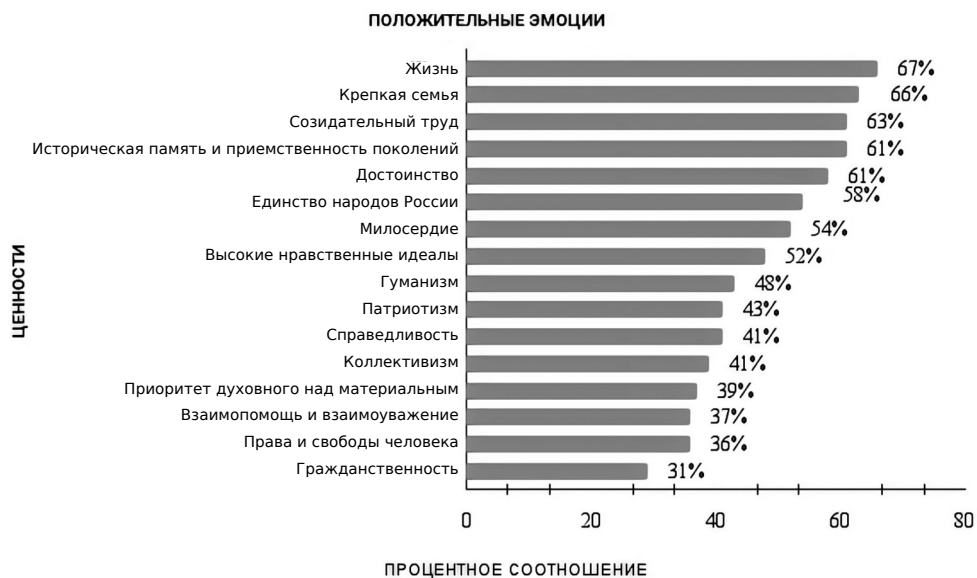
Рисунок 1. Восприятие студентами ценностей через положительное эмоциональное отношение Источник: здесь и далее диаграммы выполнены авторами.