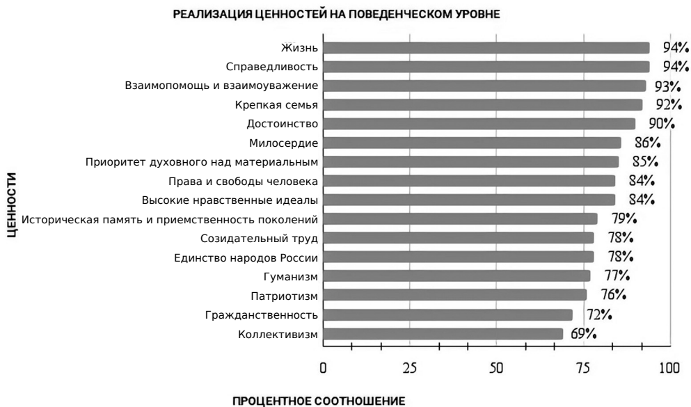
Рисунок 4. Восприятие студентами ценностей через поведенческую самореализацию

Так, по результатам обработки данных было выявлено, что в восприятии респондентов наиболее реализованной ценностью стала ценность «Жизнь», ценность «Справедливость» чуть менее выражена. Наименее же поведенчески реализованной в восприятии респондентов стала ценность «Коллективизм», на долю которой приходится чуть больше половины случаев.