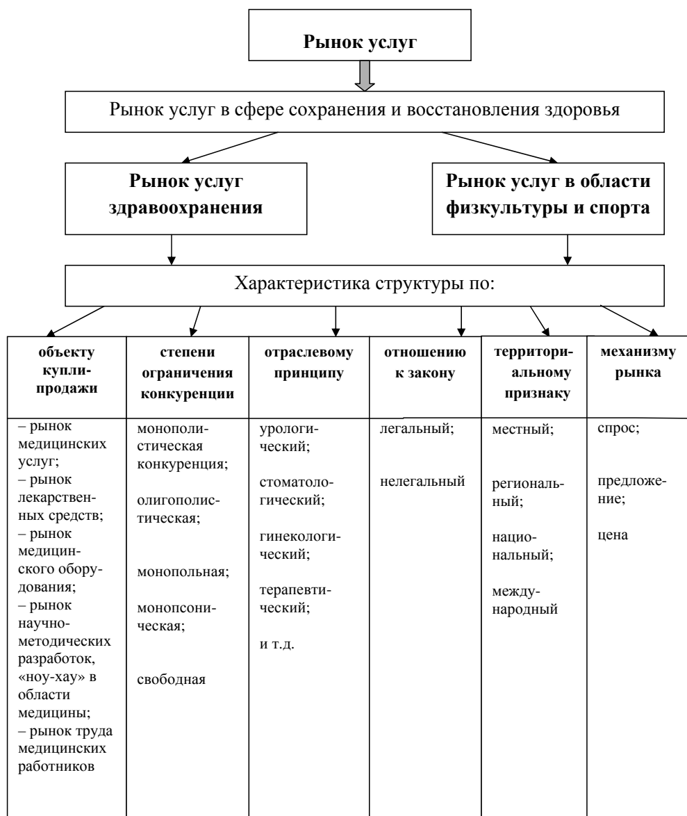
Рис. 2. Рынок услуг в здравоохранении и характеристика его структуры

о необходимости разработать комплекс мер, направленных на стимулирование интереса граждан к заключению договоров ДМС, а также на «...повышение доверия страхователей к страховщикам и к страхованию как инструменту защиты от различных рисков, в том числе путем повышения эффективности контрольно-надзорной деятельности, а также на усиление защиты прав и интересов застрахованных лиц» [6]. Однако, по нашему мнению, главной причиной роста рынка платных медицинских услуг является ненадлежащее качество бесплатной медицинской помощи. Как показывает статистика аналитического центра Юрия Левады, более половины опро-