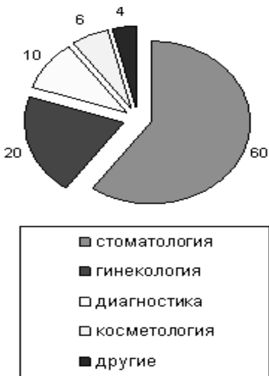
Рис. 5. Основные сегменты рынка частной медицины в России, %

Российский рынок платной медицины сегодня предлагает услуги потребителю как минимум по 34 основным медицинским специальностям. По оценке экспертов, крупнейшим сегментом рынка частной медицины в России является стоматология. Этот сегмент оценивается экспертами в 60% (рис. 5).