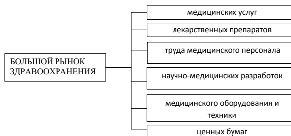
Рис. 1. Структура «большого рынка» здравоохранения

техники, методов организации медицинской деятельности, фармакологических средств, реализуемых в условиях конкурентной экономики [8]. Он является основным в структуре рынка общественного здоровья.