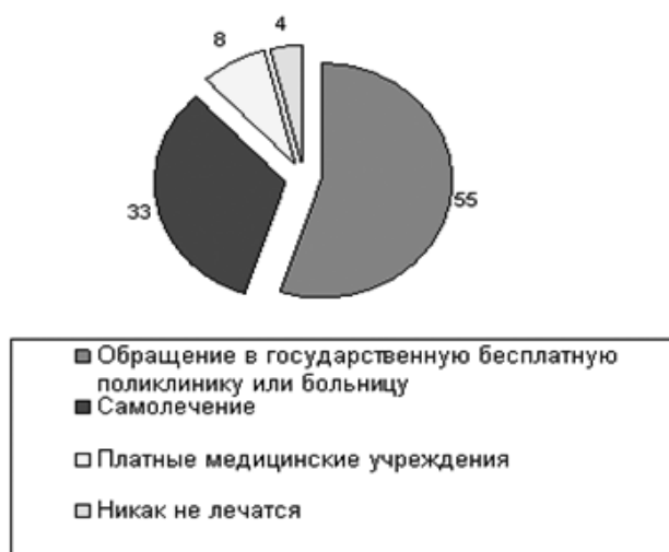
Рис. 3. Поведение россиян в случае возникновения проблем со здоровьем, %

же предпочитают обращаться в государственную бесплатную поликлинику или больницу в случае возникновения проблем со здоровьем (рис. 5). Самолечением занимается каждый третий (33%), к услугам платных медучреждений прибегают лишь 8%. Еще меньше людей руководствуются принципом «само пройдет» и пускают лечение на самотек (4%).